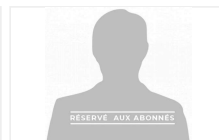
AETHER FINANCIAL SER...